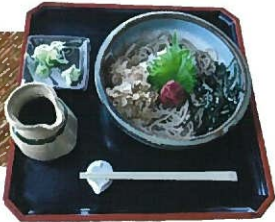
▲自家製の梅を使用。爽やかな味わいでこれからの季節におススメです。